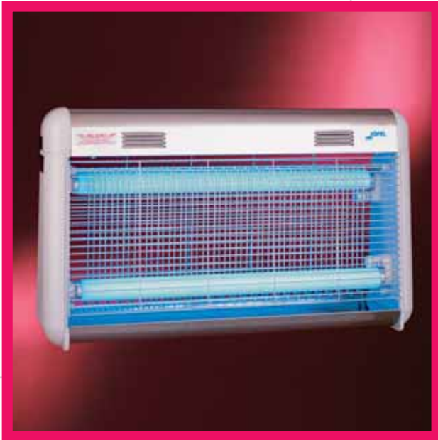
▲ AJ 55000 / ▲ AJ 55010

Eliminadores de insectos - Insect killers - Destructeurs d'insectes - Insektiziden