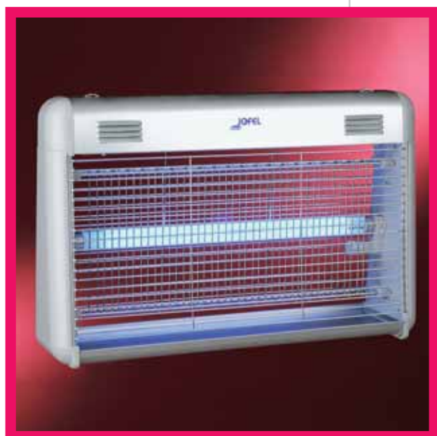
▲ AJ 23500 / ▲ AJ 23510

□ Hergestellt aus Aluminium (AJ 22500) oder Chromstahl (AJ 22510), handelt es sich um eine umweltschonende Insektenfalle in Gitterform mit niedrigem Verbrauch, denn sie verfügt über zwei UV-Röhren à 22 W. Geeignet für eine Oberfläche von 200 m. 2