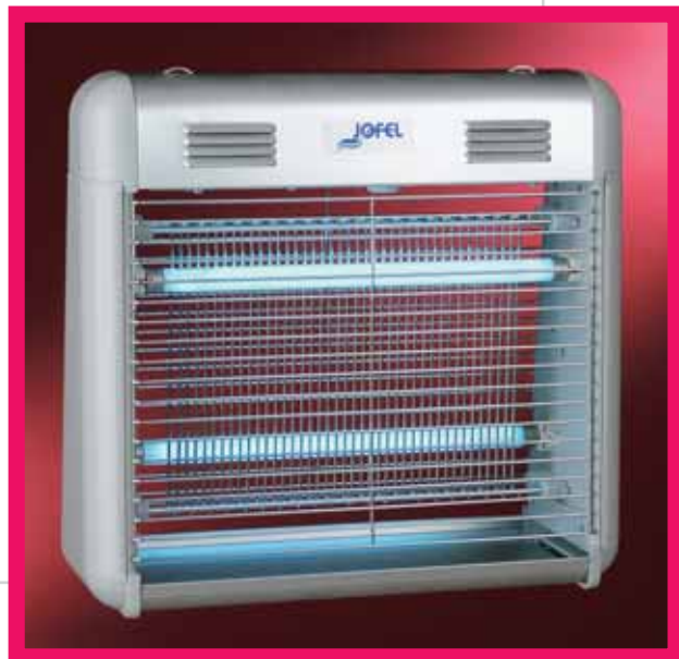
▲ AJ 21500 / ▲ AJ 21510

Eliminadores de insectos - Insect killers - Destructeurs d'insectes - Insektiziden