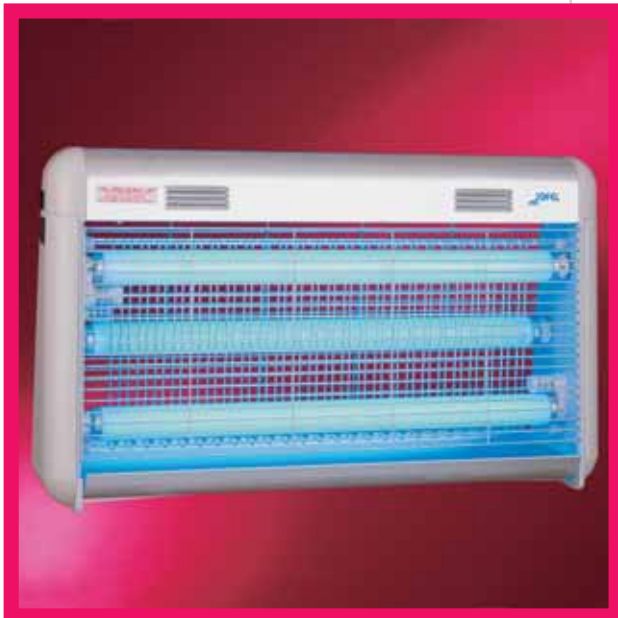
▲ AJ 57000 / ▲ AJ 57010

□ Hergestellt aus Aluminium (AJ 54000) oder Chromstahl (AJ 54010), handelt es sich um eine umweltschonende Insektenfalle in Gitterform mit niedrigem Verbrauch, denn sie verfügt über zwei UV-Röhren à 20 W. Geeignet für eine Oberfläche von 400 m. 2