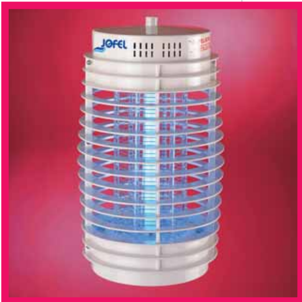
▲ AJ 11000 / ▲ AJ 12000

□ Aus Aluminium (AJ 55000) oder Chromstahl (AJ 55010) hergestellte Insektenfalle. Sie verfügt über zwei große UV-Röhren à 20 W. Geeignet für eine Oberfläche von 500 m. 2