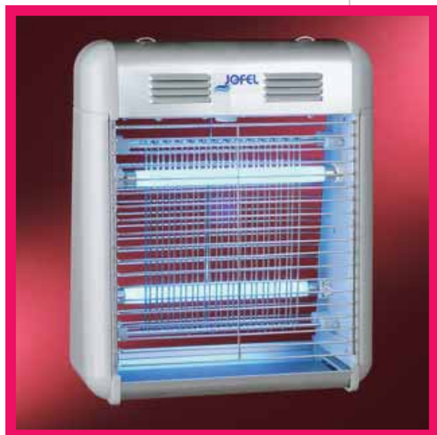
▲ AJ 22500 / ▲ AJ 22510

□ Hergestellt aus Aluminium (AJ 21500) oder Chromstahl (AJ 21510), handelt es sich um eine umweltschonende Insektenfalle in Gitterform mit niedrigem Verbrauch, denn sie verfügt über zwei UV-Röhren à 8 W. Geeignet für eine Oberfläche von 350 m. 2