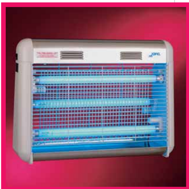
▲ AJ 56000 / ▲ AJ 56010

□ Hergestellt aus Aluminium (AJ 57000) oder Chromstahl (AJ 57010), handelt es sich um eine umweltschonende Insektenfalle in Gitterform mit niedrigem Verbrauch, denn Sie verfügt über drei UV-Röhren à 20 W. Geeignet für eine Oberfläche von 700 m. 2