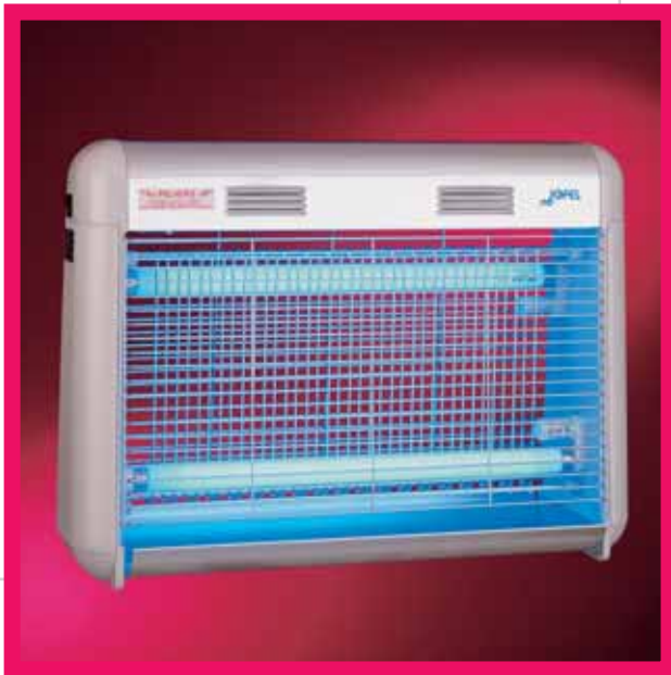
▲ AJ 54000 / ▲ AJ 54010