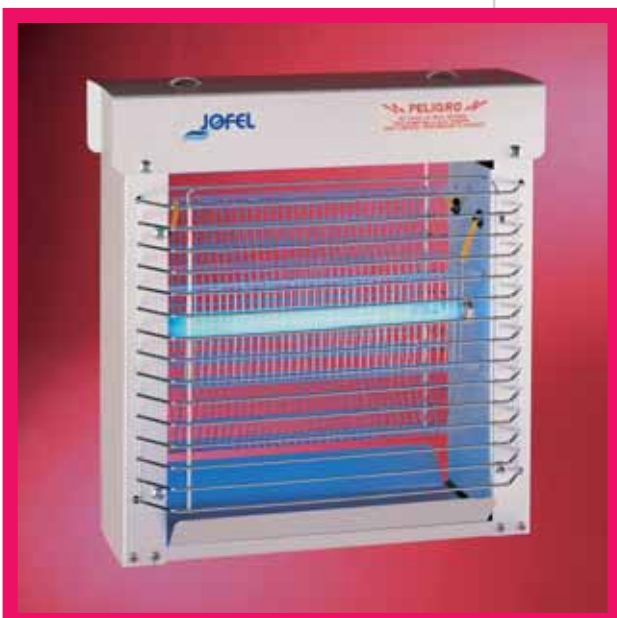
▲ AJ 22000 / ▲ AJ 22010

□ Hergestellt aus ABS Kunststoff, handelt es sich um eine umweltschonende Insektenfalle in Gitterform mit niedrigem Verbrauch. Sie verfügt über eine 6 bzw. 11 W UV-Röhre. Geeignet für eine Oberfläche von 90 bzw. 125 m. 2